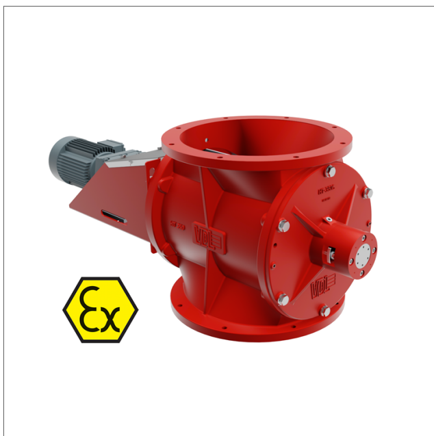
HT-S-EX - rotorluss för medelhöga undertryck, <40000 pa

Rotorluss HT-S-EX, ATEX-godkänd, för pneumatiska transportsystem, försedd med 8-bladig rotor. Lackerad i RAL 5009 som standard men går att få i andra färger. Lämplig för transport av pulver och granulat med medelhöga differentialtrycksnivåer >40.000 Pa, i miljöer med höga temperaturer (max. 300 °C) och med slipande medel.