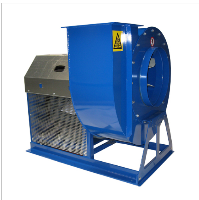
JK-K - Fan belt driven

De indirekta centrifugala fläkten JK-K är konstruerad för materialhantering. Utrustad med självrengöringshjul med bakåtlutande skovlar och aerodynamiska intag. Fläkthjulen är statiskt och dynamiskt balanserade. Remskivorna är axelmonterade med taperlockbussning, vilket underlättar vid byte av fläkthastighet. Max. driftstemperatur: 60°C. Med kylvingar: Upp till 200°C. Antal blad reduceras med 2 för pappershjul. Finns i anti-gnistversion med rostfritt stål och explosionsbeständig (Eex) motor