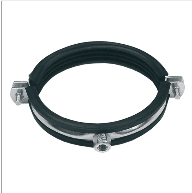
PISR - Rörstöd

Rörstöd med gummiinlägg PISR. *076 för dimensioner 076 och 080. *102 för dimensioner 100 och 102. *125 för dimensioner 125 och 127. *152 för dimensioner 150 och 152. *200 för dimensioner 200 och 203. Anslutning M8/M10 för samtliga dimensioner.